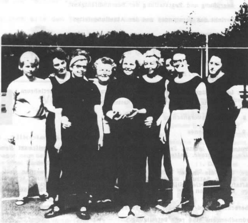
Die Faustballgruppe im Sommer 1966