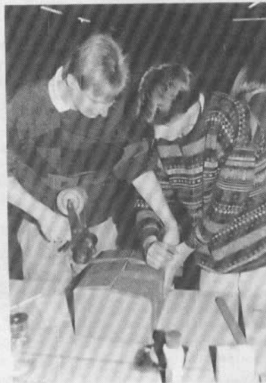
Am 16. Dezember 1990 verpackten zehn Helfer in der Brakenhoffschule insgesamt 678 kg Lebensmittel.