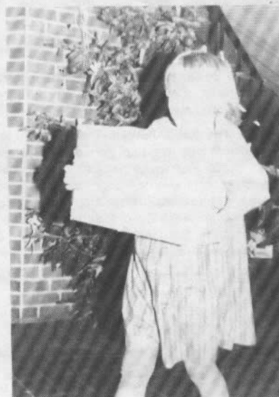
Auch die Jüngsten halfen mit.