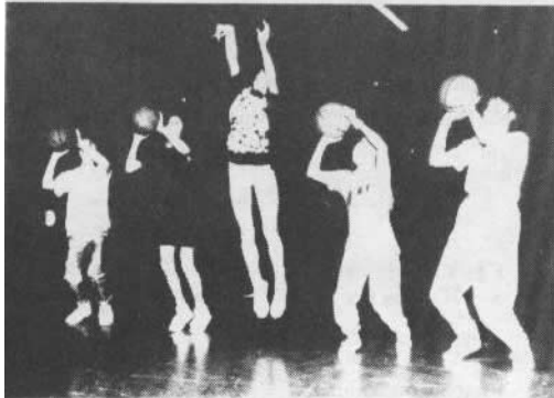
Jugendliche beim Training in der Hössenhalle

Dank Vilmantas Matkevicius kontinuierlicher Zusammenarbeit mit einigen Westersteder Schulen – er trainiert nach Absprache mit den Lehrern einige Klassen während des Sportunterrichts – tauchen immer wieder neue Talente auf.